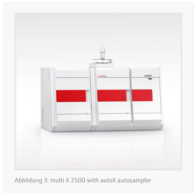
Abbildung 3: multi X 2500 with autoX autosampler

Das APU 28 SPE-System eignet sich sehr gut für die automatische Vorbereitung von AOX- und SPE-AOX-Proben. Durch die vollständige Automatisierung des Arbeitsablaufs, einschließlich aller Adsorptions- und Spülschritte, ist die APU 28 SPE der ideale Partner für hohen Probendurchsatz. Der multi X 2500 ist ein hervorragendes Instrument für die AOX-Bestimmung (sowie EOX, POX und TX/TOX) in allen Arten von Wasser-, Schlamm- und Bodenproben sowie anderen organischen Flüssigkeiten und Feststoffen (z. B. Altöl). Aufgrund seiner enormen Flexibilität ist der Wechsel zwischen verschiedenen Parametern schnell und einfach möglich. Das macht den multi X 2500 sehr effizient und spart wertvolle Zeit und Kosten.