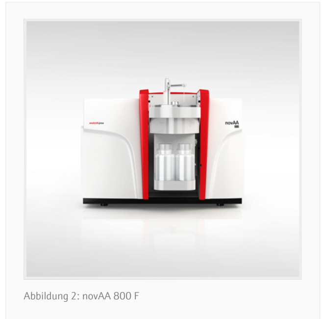
Abbildung 2: novAA 800 F

Das novAA 800 F für die Flammen-AAS ermöglicht eine schnelle und präzise Analyse des Kupfergehalts von Erzproben nach einem einfachen Aufschluss auf einer Heizplatte in Salpetersäure oder Königswasser. Bei gleichzeitiger Verwendung des AS-FD-Probengebers wurden sowohl die Benutzerfreundlichkeit als auch die Produktivität erheblich gesteigert, da der Probengeber (i) eine automatische Überbereichsverdünnung von Proben mit unbekanntem und schwankendem Kupferkonzentrationen und (ii) eine automatische Vorbereitung von Kalibrierstandards ermöglicht.