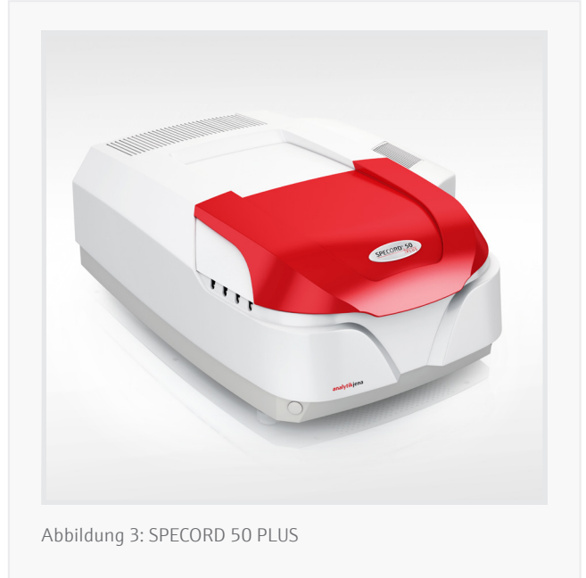
Abbildung 3: SPECORD 50 PLUS

Das Spektralphotometer SPECORD 50 PLUS ermöglicht die schnelle, präzise und einfache Bestimmung der Konzentration wichtiger Wasserparameter in Abwasserproben. Mit Hilfe der hochpräzisen Optik können die Kalibrierkurven mit guten R^2 -Werten erstellt werden. Die automatische Berechnung der Konzentration in Abhängigkeit von Verdünnung und Einwaage in der Software ASpect UV unterstützt die schnelle und fehlerfreie Berechnung der Konzentration verschiedener Parameter in den Abwasserproben. Der Einsatz von Zubehör wie Autosampler, Küvettenwechsler oder Küvettenkarussell unterstützt Hochdurchsatzmessungen. Weiteres Zubehör ermöglicht die Analyse von trüben und niedrig konzentrierten Proben. .