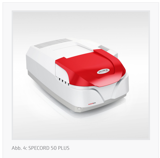
Abb. 4: SPECORD 50 PLUS

Analytik Jena verfügt über langjährige Expertise in der UV/Vis-Spektralphotometrie, hochwertigen und langlebigen Spektralphotometersystemen wie dem SPECORD 50 PLUS und praxisnahen Lösungen bei der Bestimmung wichtiger Qualitätsparameter für pflanzliche Öle und Speiseöle. Im aktuellen Fallbeispiel wurde die Qualität von Palmöl entlang der Wertschöpfungskette beurteilt. In Anlehnung an die ISO 17932:2011 wurden DOBI-Werte und Carotingehalte von rohem Palmöl (CPO), gebleichtem sowie raffiniertem Palmöl bestimmt. Die spektralphotometrische Qualitätsbewertung ermöglicht eine schnelle und zuverlässige Auswertung ohne aufwändige Probenvorbereitung. Darüber hinaus wurde das Spektralphotometer SPECORD 50 PLUS erfolgreich für die Analyse der Palmölqualität an Schlüsselstellen der Wertschöpfungskette eingesetzt. Im Gegensatz zu Xenon-Blitzlampensystemen (z. B. ScanDrop 2 ), die eindeutig auf eine schnelle Detektion ausgelegt sind, ist das SPECORD 50 PLUS und die dazugehörige ASpect UV Software für eine genaue Parameterauswertung von hohen Carotinkonzentrationen in CPO über die Verarbeitung bis hin zu gebleichtem Öl und Downstream-Produkten, wie raffiniertem Palmöl, ausgelegt. Hervorzuheben ist dabei die Leistungsfähigkeit des Gerätes im untersten