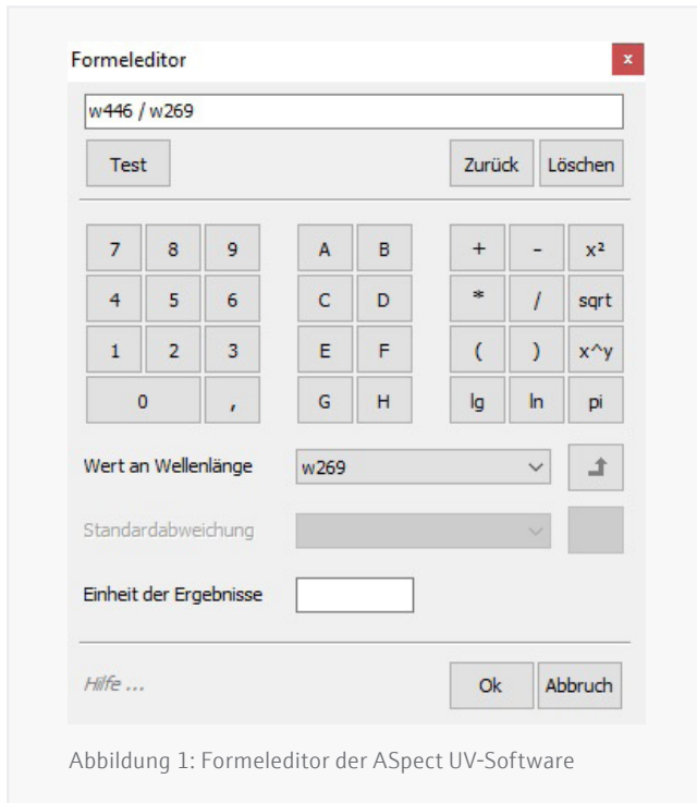
Abbildung 1: Formeleditor der ASpect UV-Software

Konzentration \rho (in g/100 ml) der Palmöl/Isooctan-Lösung (Tabelle 2) multipliziert mit der optischen Weglänge l (1 cm). Die Carotinkonzentration wird in mg/kg angegeben. Die Software ASpect UV bietet eine eingebaute Funktion zur einfachen Berechnung des DOBI-Wertes (Abbildung 1).