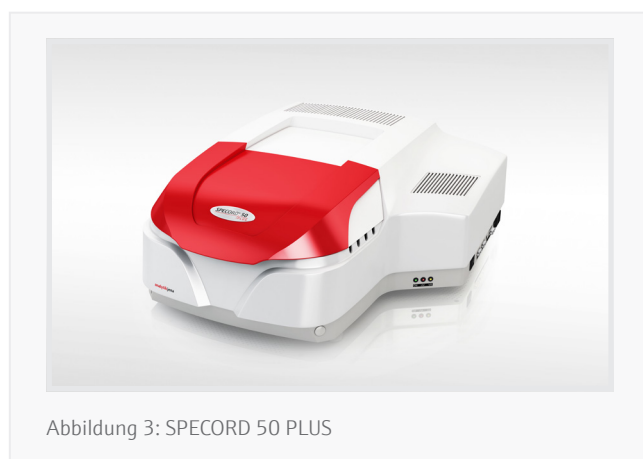
Abbildung 3: SPECORD 50 PLUS

Die hier beschriebene spektralphotometrische Methode ermöglicht wichtige Einblicke in die Entwicklung von Phytoplankton in Oberflächenwasser. Der Wasserqualitätsparameter Chlorophyll a ist eine labile Verbindung, die ein enges Fenster für eine zuverlässige Quantifizierung bietet. Jedoch ermöglicht die in DIN 38409-60 beschriebene Methode eine schnelle und genaue Bestimmung mit relativ einfacher Probenvorbereitung. Außerdem eröffnet die einfache spektralphotometrische Bestimmung einen Zugang zu verschiedensten Komponenten (z. B. anderen Chlorophyllen und Carotinoiden, Phycobilinmolekülen). So bietet das SPECORD 50 PLUS (siehe Abb. 3) eine starke spektroskopische Leistung, sowie geeignetes Zubehör zur Erfüllung der Anforderungen der Norm hinsichtlich Küvetten-schichtdicke (50 mm) und einen Küvettenwechsler für einen höheren Durchsatz (6-fach Küvettenwechsler, sowohl für 10 als auch für 50 mm Schichtdicke). Schließlich