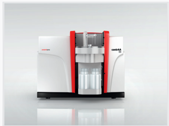
Abbildung 4: contrAA 800