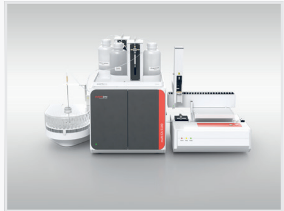
Abbildung 3: ICprep automatic